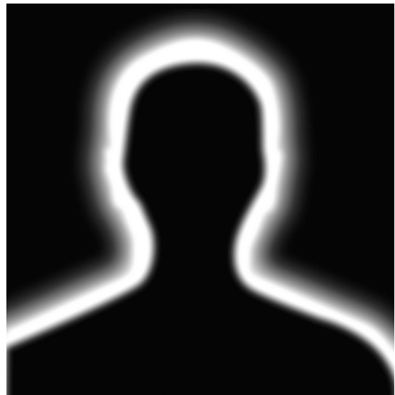
Le client vu par lui-même

En réalité, et le Mouvement du Nid le sait d'expérience, les personnes prostituées sont avant tout - femmes et hommes - des personnes en manque d'avenir, en état de précarité affective, économique, sociale, culturelle, des jeunes en rupture familiale, des victimes de violences, des personnes endettées, manipulées par des exploiters de toutes sortes.